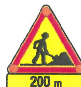
AK5 + KM1 + R2 Travaux + Indication de distance + Triflash