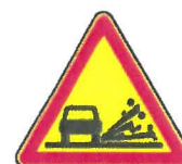
AK22 Projection de gravillons