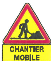
AK5 + KM9 Travaux + Nature de l'obstacle