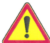
AK14 Autres dangers. La nature du danger peut être précisée par une inscription (KM)