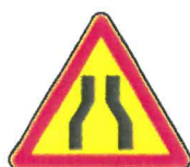
AK3 Chaussée rétrécie